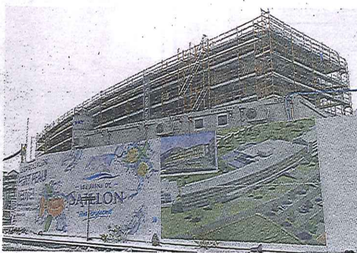
Le nouvel hôtel 4 étoiles plus – le chantier derrière et la maquette du projet au premier plan – ouvrira ses portes au printemps 2016.

L'investissement consenti pour ce nouvel hôtel est de l'ordre de 35 millions de francs. A terme, les Bains de Saillon emploieront 220 personnes, contre 160 aujourd'hui. ● OR