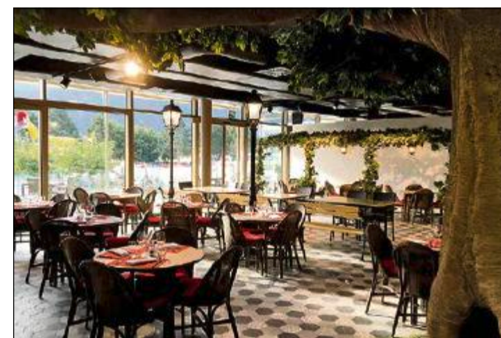
L'un des six restaurants du site: la cuisine italienne du Piazza Grande, avec son arbre magique pour les enfants.

A Valais/Wallis Promotion, Marcelline Kuonen, responsable du tourisme, constate qu'à côté du volet sportif, le domaine ressourcement, donc thermalisme, est un bon créneau pour le tourisme valaisan et que l'ouverture du nouvel hôtel de Saillon vient valoriser l'offre en plaine, ce qui est «excellent». L'objectif est d'amener davantage d'hôtes étrangers car l'emplacement central permet de nombreuses activités. «Les Chinois aiment le thermalisme!», relève-t-elle notamment. cj